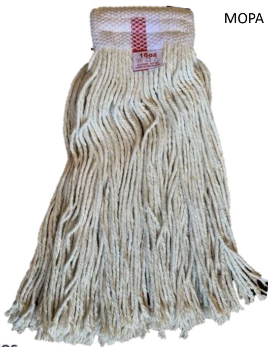
MOPA ALGODÓN 16OZ